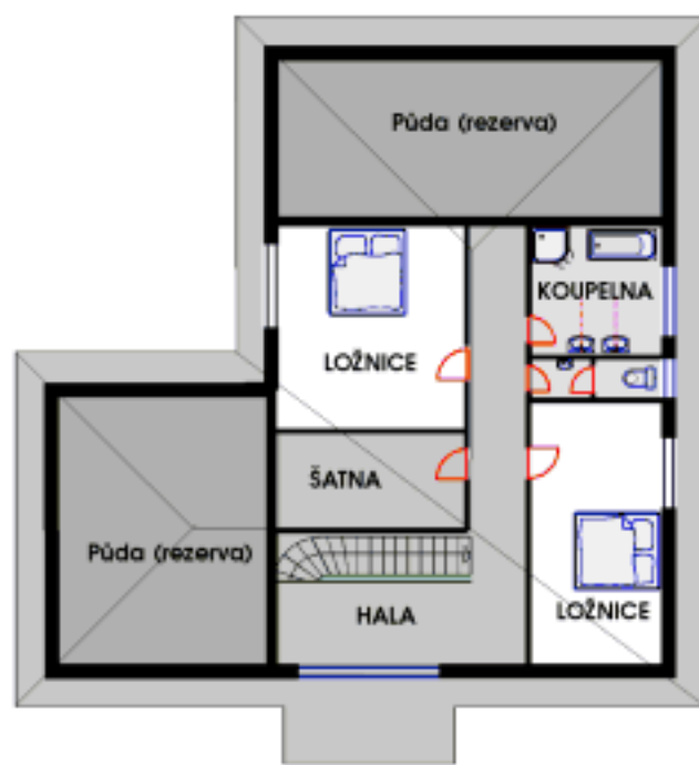
PODKROVÍ PLOCHA 98 m 2

OBÝVACÍ POKOJ 30 m 2 LOŽNICE 20,5 m 2 JÍDELNA, KUCHYŇ 29 m 2 KOUPELNA 9,2 m 2 DOMÁCÍ PRÁCE 10 m 2 ŠATNA 7,5 m 2 ZÁDVEŘÍ 12 m 2