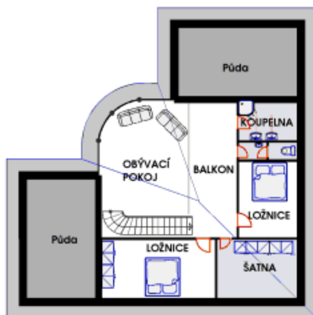
PODKROVÍ PLOCHA 106 m 2 (75m 2 )

Jedna z velmi často žádaných variant domu typu "bungalow" Vivace s obývacím pokojem s balkonem otevřeným do krovu. Dům je možno doplňovat a upravovat jak je popsáno na listu Vivace 1. Obraz dokumentuje i