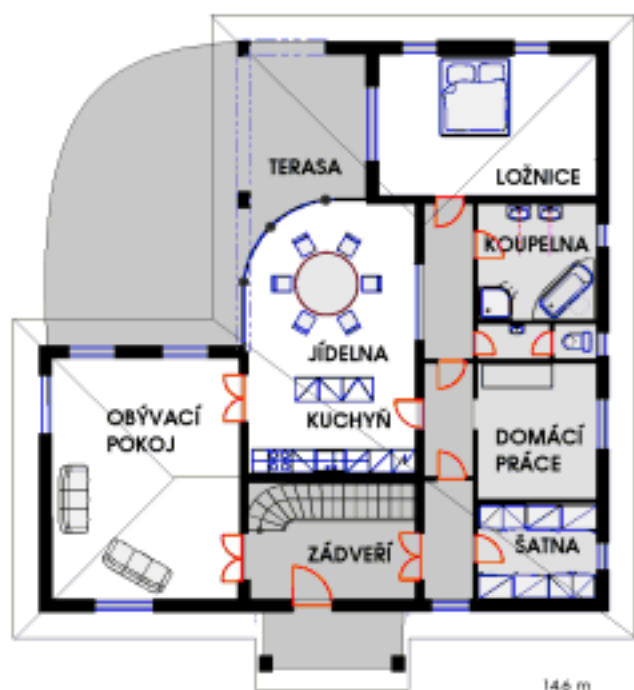
PŘÍZEMÍ PLOCHA 146 m 2